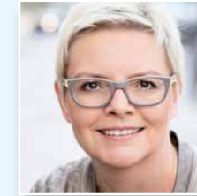
Sabine Dittmar Hausärztin, Bundestagsabgeordnete SPD