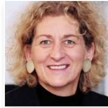
Lisa Braun Presseagentur Gesundheit